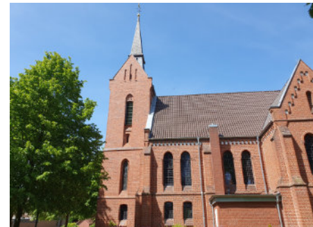
Christuskirche in Hollen

Die Christuskirche in Hollen, 1896 im Stil der Neogotik erbaut, fasziniert mit gotischen Stilmerkmalen und einer reich verzierten Holzdecke im Kirchenschiff. Das ursprüngliche Kruzifix wurde bewahrt und schmückt den 1990 neu errichteten Altar.