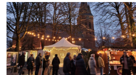
Weihnachtsmarkt in Remels

Auch abseits des Marktes lädt Uplengen mit seinen lokalen Geschäften, Lebensmittel-