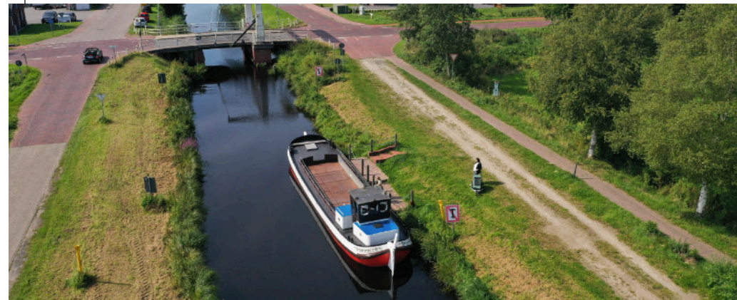
MS Ella Nordgeorgsfehnkanal

Neben den kulinarischen Genüssen prägen auch die Weite der Landschaft und die Nähe zur Natur das Leben in Ostfriesland. Die typischen Wallhecken, das grüne Marschland und vieles mehr spiegeln die Geschichte der Region wider und laden zu Spaziergängen und Entdeckungen ein.