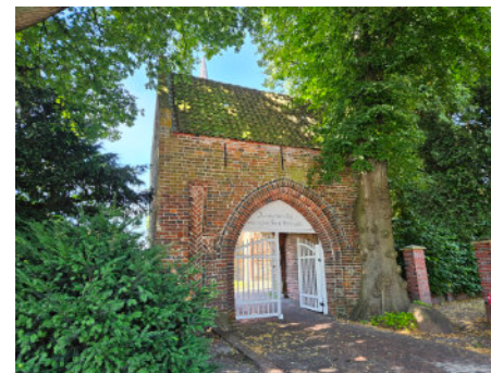
Ostertor der Kirche in Remels