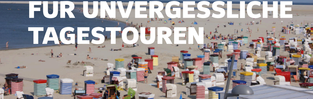
Strand von Borkum

Von Uplengen aus erreichen Sie zahlreiche spannende Ausflugsziele, die für jede Vorliebe etwas zu bieten haben – von den Ostfriesischen Inseln bis nach Amsterdam und Hamburg.