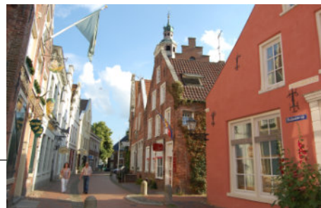
Altstadt von Leer

Auch die Küstenstadt Emden mit ihrem berühmten Otto-Huus, dem Kunstmuseum und