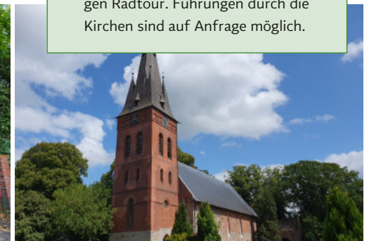
Kirche in Remels