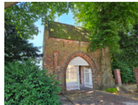
Ostertor der Kirche in Remels