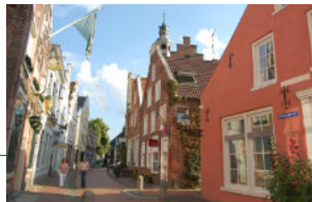
Altstadt von Leer

Auch die Küstenstadt Emden mit ihrem berühmten Otto-Huus, dem Kunstmuseum und