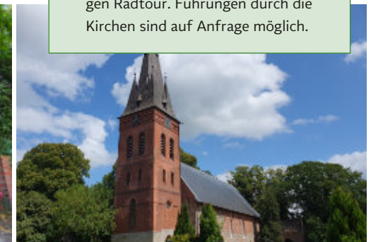
Kirche in Remels