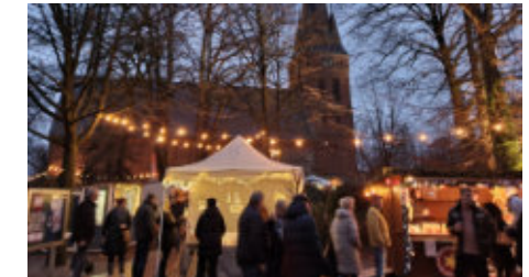
Weihnachtsmarkt in Remels

Auch abseits des Marktes lädt Uplengen mit seinen lokalen Geschäften, Lebensmittel-