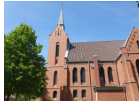
Christuskirche in Hollen

Die Christuskirche in Hollen, 1896 im Stil der Neogotik erbaut, fasziniert mit gotischen Stilmerkmalen und einer reich verzierten Holzdecke im Kirchenschiff. Das ursprüngliche Kruzifix wurde bewahrt und schmückt den 1990 neu errichteten Altar.