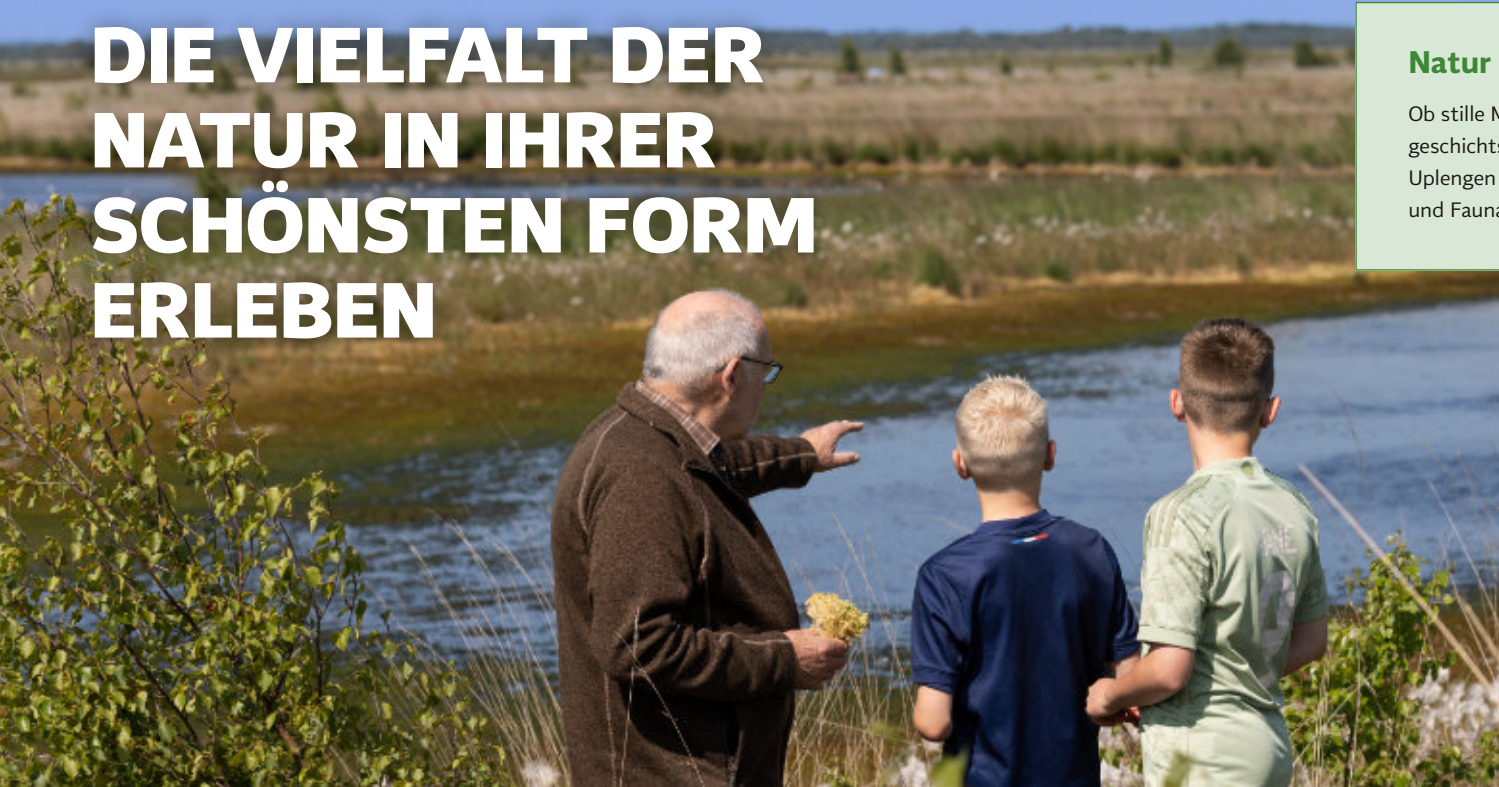
Typisch ostfriesischer Kanal in Uplengen