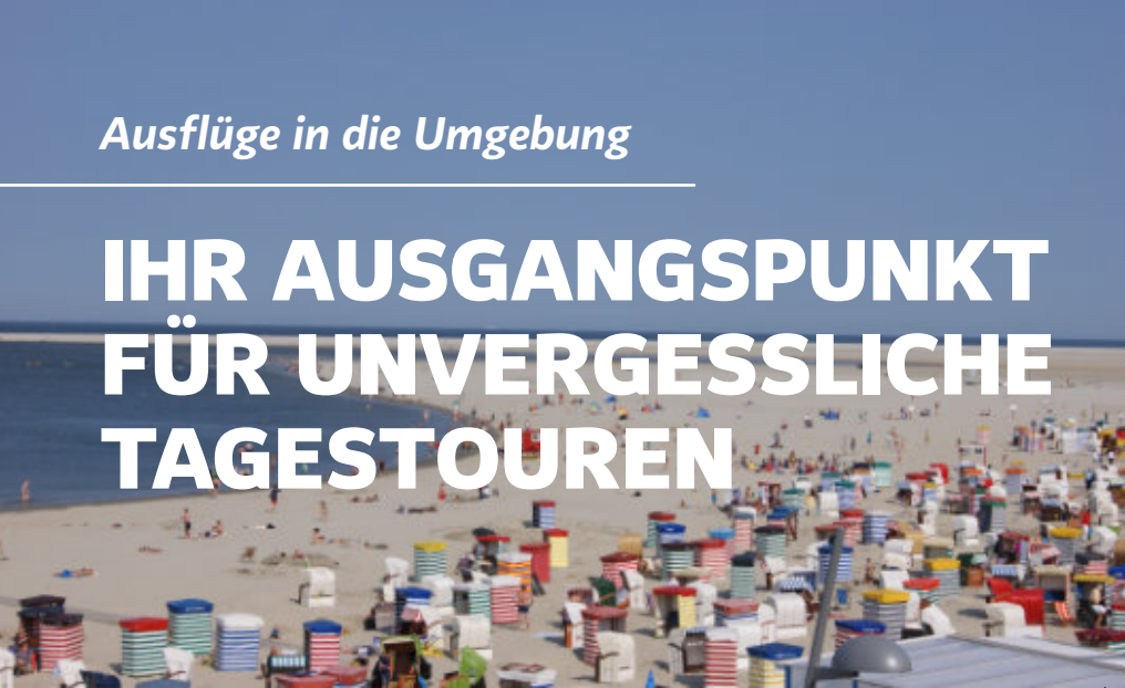
Strand von Borkum

Von Uplengen aus erreichen Sie zahlreiche spannende Ausflugsziele, die für jede Vorliebe etwas zu bieten haben – von den Ostfriesischen Inseln bis nach Amsterdam und Hamburg.